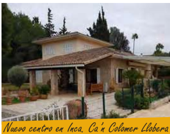
Nuevo centro en Inca, Ca'n Colomer Llobera

El mes pasado, se puso en funcionamiento el dispositivo de Centro de Día Arrels en Inca en las nuevas instalaciones del Centro en Can Colomer Llobera. Allí ofrecemos la oportunidad de un cambio de estilo de vida a todas aquellas personas con problemas de adicción y que tienen dificultades para acercarse al municipio de Palma. Iniciamos esta nueva singladura con mucho cariño e ilusión en la comarca de Inca y alrededores.