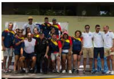
Voluntariado y organizadores de la prueba

Nuestro más sincero agradecimiento a la Policía Nacional por contar con nuestra entidad en este día y en especial a todas las personas que participaron y a las que colaboraron para que la organización de la prueba fuera excelente.